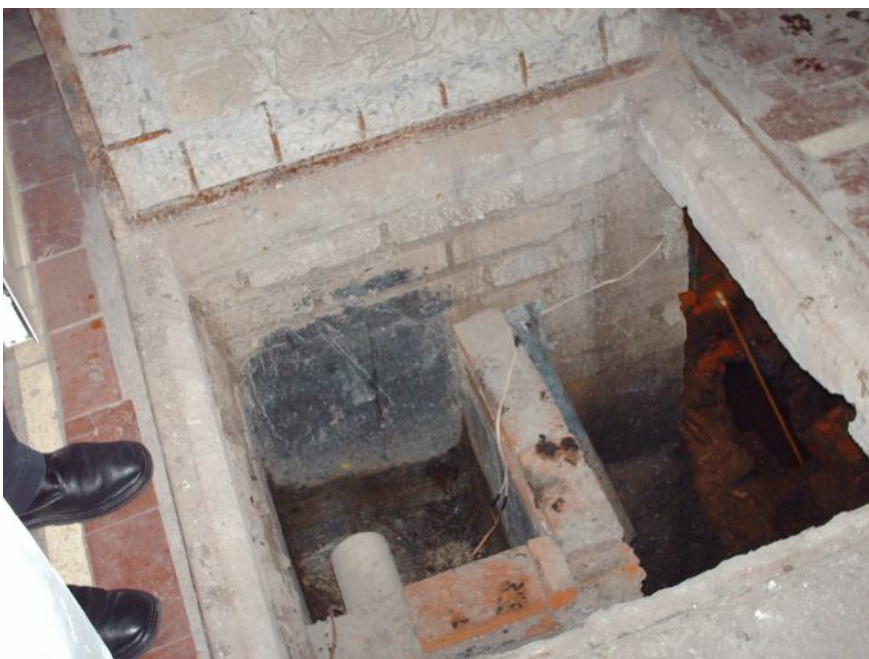
Fosa debajo de la cochera, donde llega el drenaje de una sección de la casa.

imaginará, no son nada baratos. Hay que mencionar que las ofrendas de cada domingo (limosnas), así como las entradas por servicios en las oficinas, apenas son suficientes para cubrir el gasto corriente. Por eso nos vemos en la necesidad de solicitar constantemente el apoyo de todos, haciendo un esfuerzo especial para mantener nuestro inmueble parroquial lo más decoroso posible. Próximamente anunciaremos más actividades de recaudación de fondos. Agradecemos, de antemano, tu colaboración.