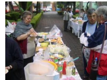
Buen ánimo y entusiasmo de quienes iniciaron labores desde temprano.