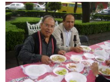
Jóvenes y Sacerdotes, todos trabajando por el bien parroquial.