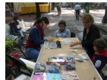
Los niños también disfrutaron del evento, en la tómbola fueron niños los que se llevaron la bici y la tele, otros pasaron largo rato en los juegos de mesa.