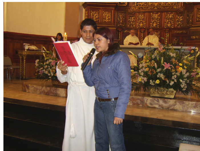
Participación activa de los laicos en la Celebración Eucarística.

¿Cuántas veces hemos escuchado la frase "Voy a oír misa"? Seguramente muchas. Y lo que es verdaderamente triste es que esta frase cada día se apega más a la realidad. Muchos son los "vicios" que tenemos al participar en una celebración litúrgica, es por ello que conviene detenernos a meditar un poco acerca de este tema. Nos centraremos, principalmente, en la celebración eucarística.